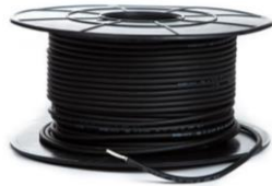
DC-kaapeli 4 mm

- PV-Stick –liittimet ja standardin vaatimat varoitustarrat